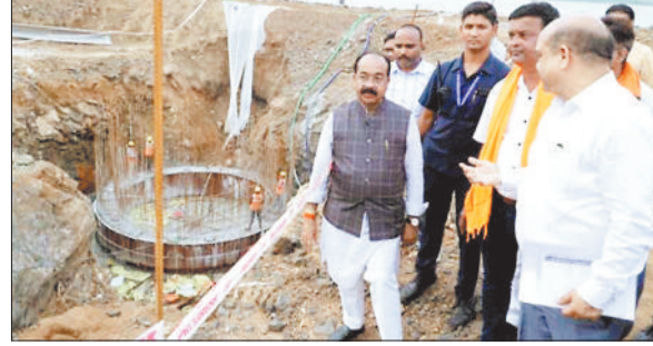
निर्माणधीन वॉटर ट्रीटमेंट प्लांट का निरीक्षण करते उप मुख्यमंत्री।