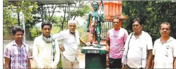
समिति के बाहर खड़े किसान।

किसानों का कहना है कि समय पर सरना धान का बीज न मिलने से किसान परेशान हैं। धान की खेती यहां किसानों के लिए आजीविका के साथ-साथ आर्थिक प्रगति का भी एक माध्यम है। इस खेती में किसान अपना पूरा की जान लगा देता है।