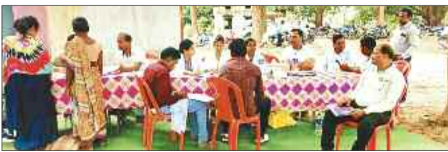
शिविर में पहुंचे ग्रामीण।

पहाड़ी कोरवा समुदाय के लोगों को लाभान्वित करने बगीचा विकासखंड के विभिन्न ग्रामों में शिविर का आयोजन किया जा रहा है। इस कड़ी में आज ग्राम दनगिरि, ब्लादापारा, कुहापानी सरबक्रोबो में शिविर का आयोजन किया गया। जिससे विशेष पिछड़ी जनजाति समुदाय के सभी पात्र हितग्राहियों