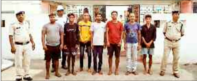
डीएसपी सुरक्षा की पीटाई करने वाले सभी सात आरोपी पुलिस गिरफ्त में।