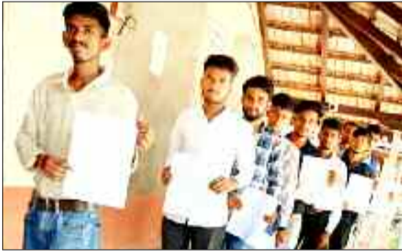
साक्षात्कार देने अपनी बारी का इंतजार करते युवक।