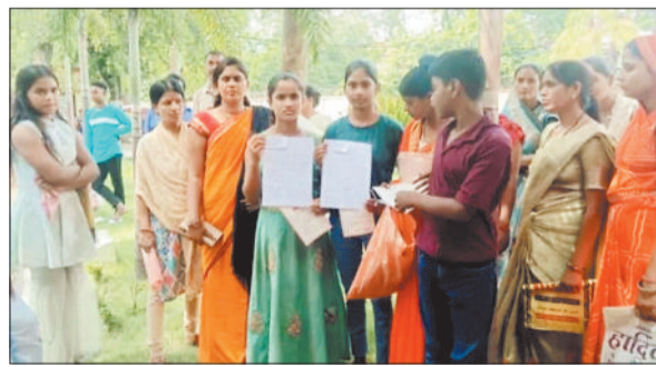
शाला प्रवेशोत्सव के दौरान उपस्थित शिक्षिकाएं व विद्यार्थी।

शाला प्रवेशोत्सव का मुख्य उद्देश्य विद्यार्थियों को प्रोत्साहित करना उनकी आत्मविश्वास को बढ़ाना और उन्हें नए सत्र में सफलता की कामना करना होता है। यह उत्सव छात्रों के बीच एक मेलजोल वातावरण है। हमारे जीवन का यादगार पलों में से एक यह भी है कि दो माह की छुट्टी के बाद बच्चों को विद्यालय में आने की उत्सुकता देखी गई। इस शाला प्रवेश उत्सव में अतिथियों द्वारा किताबें, सफलता की वितरण किया गया। नगर पंचायत अध्यक्ष द्वारा सभी बच्चों को नेवता भोज