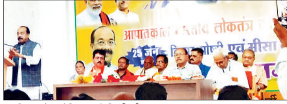
कार्यक्रम को संबोधित करते डिप्टी सीएम।

श्री साव ने कहा कि भारतीय जनता पार्टी ने भारतीय लोकतंत्र के उसी काले अध्याय से रू.ब.रू कराते हुए आपातकाल का काला दिवस मानकर संविधान और लोकतंत्र के नाम पर देश में पाखंडपूर्ण राजनीति कर रही कांग्रेस के इस इस कलंकित राजनीतिक चरित्र से परिचित कराने