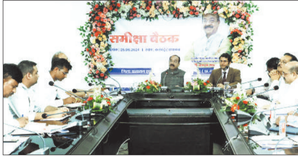
अधिकारियों की बैठक लेते डिप्टी सीएम अरुण साव।

उप मुख्यमंत्री श्री साव ने लोक निर्माण विभाग के कार्यों की समीक्षा के दौरान ईई पीडब्ल्यूडी से मिलने में चल रहे कार्यों की जानकारी ली। उप मुख्यमंत्री श्री साव ने कहा कि कार्यों का सही समय में गुणवत्ता के साथ पूरा होना जरूरी है। काम में देरी से जहां काम की लागत बढ़ती है और गुणवत्ता